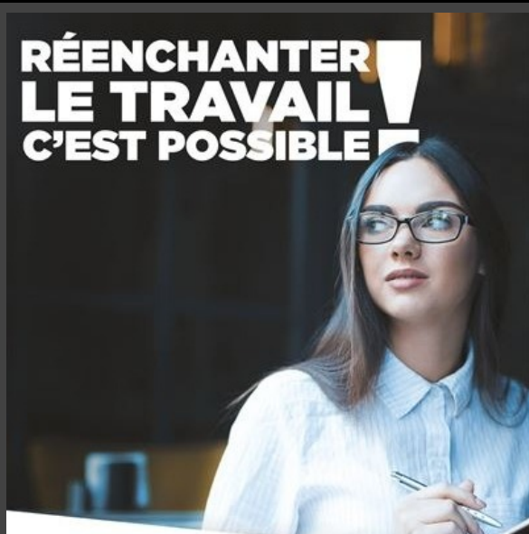
Livre : Réenchanter le travail c'est possible