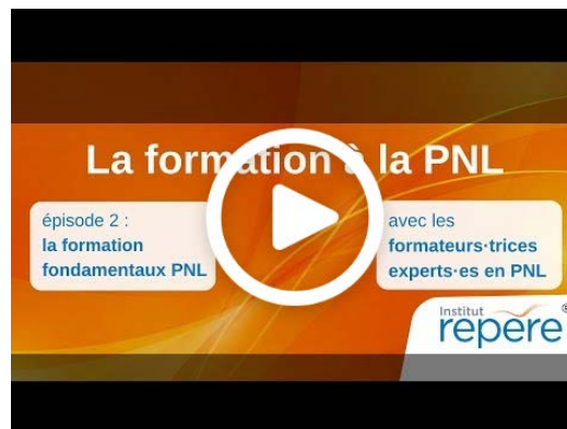
Présentation vidéo Fondamentaux PNL