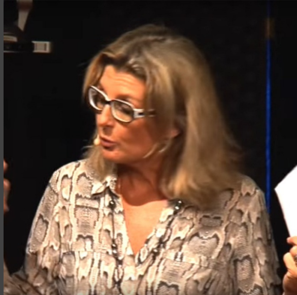
Vidéo : Bien-Être au travail