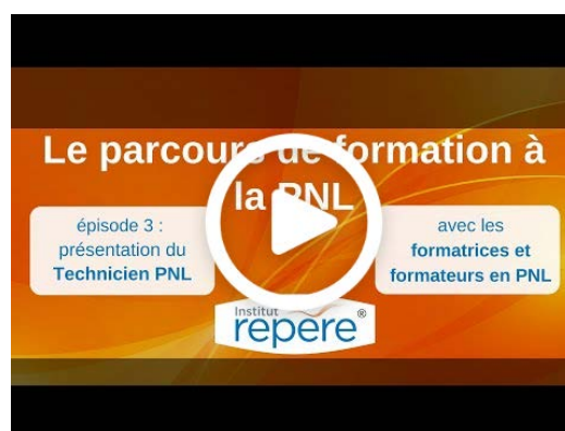
Présentation vidéo Technicien PNL

Informations supplémentaires et inscriptions au 01 43 46 00 16