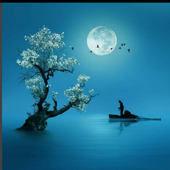
Métaphore : Notre paysage intérieur