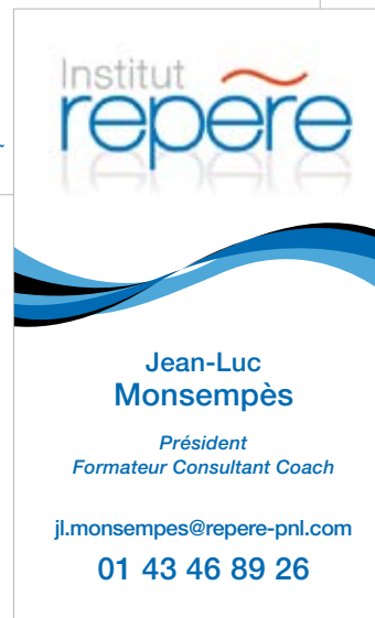
Carte de visite