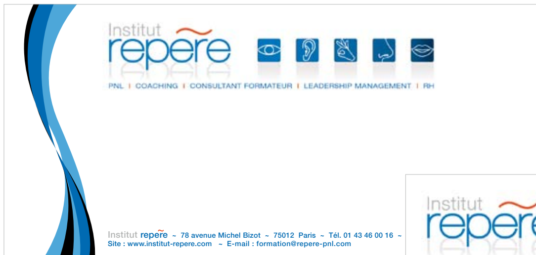
Carte de correspondance

Voici, en accord avec la charte graphique, les documents de base de la communication Institut Repere.