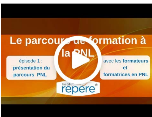
Présentation vidéo Parcours PNL