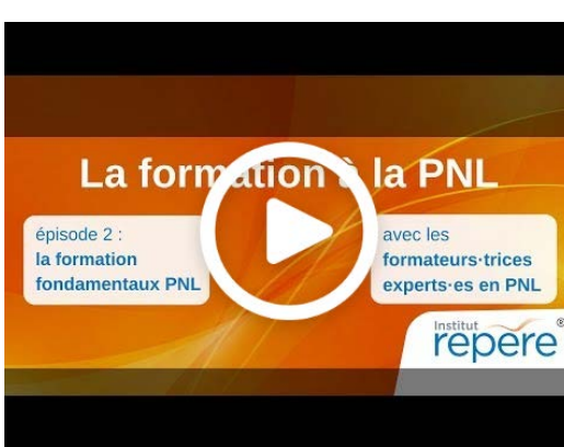
Présentation vidéo Fondamentaux PNL