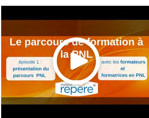
Présentation vidéo Parcours PNL