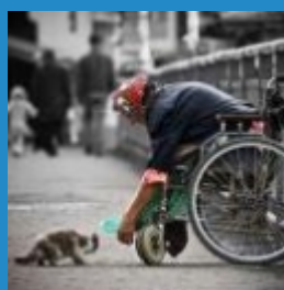
METAPHORE Chaque personne donne ce qu'elle a dans le cœur