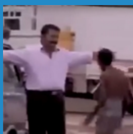
VIDEO L'homme généreux