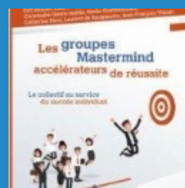
LIVRE DU MOIS Les groupes Mastermind : accélérateurs de réussite